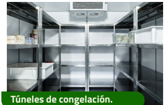
Túneles de congelación.