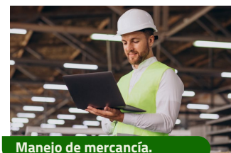
Manejo de mercancía.