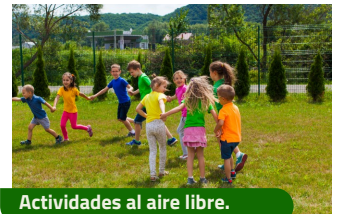
Actividades al aire libre.