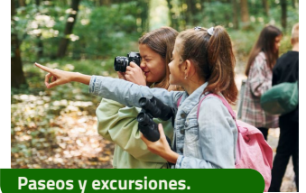
Paseos y excursiones.