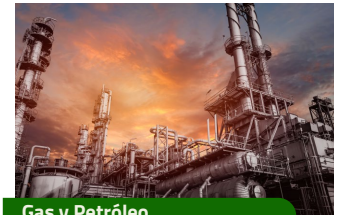
Gas y Petróleo.